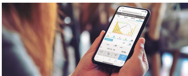
Tutoriel de connexion et d'enregistrement au Smart Cloud

1. Via l'interface WLAN CZ-TAW1, connectez et enregistrez la pompe à chaleur au service Aquarea Smart Cloud (contrôle par l'utilisateur final) - Step 1